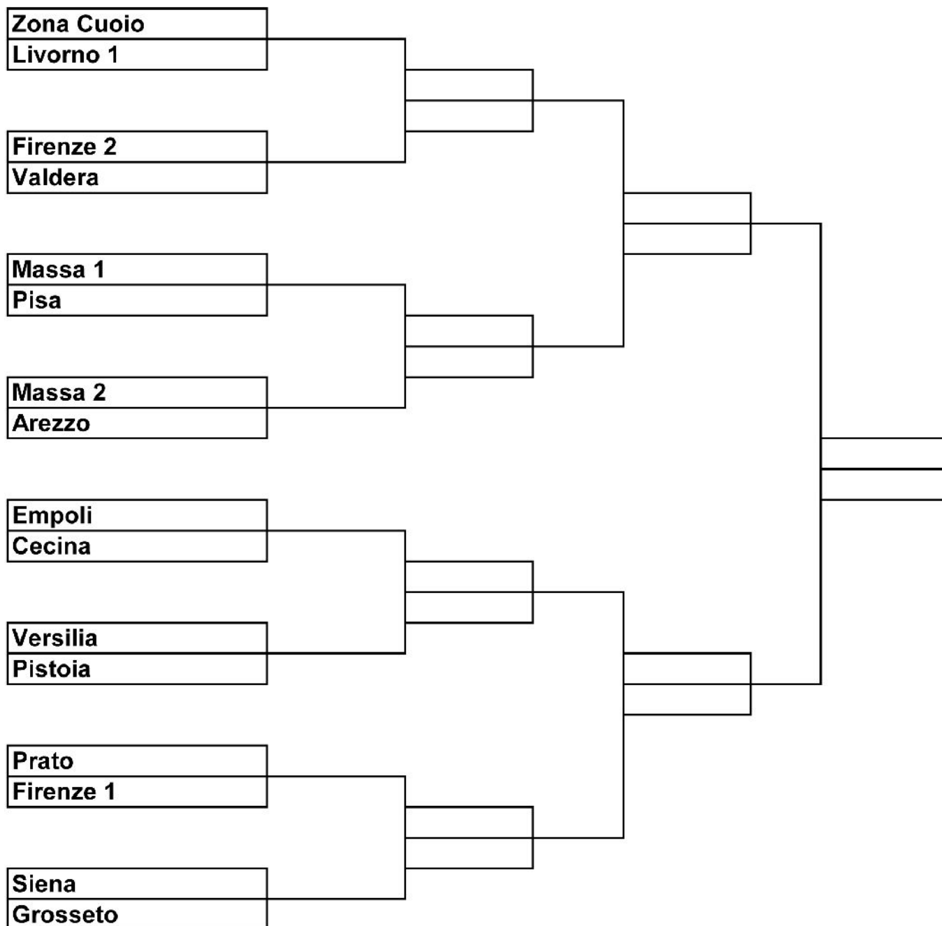
Tabella fasi Finali Regionali di Calcio a 5 Maschile

Martedì 19, Mercoledì 20 e Giovedì 21 Maggio Ottavi di finale