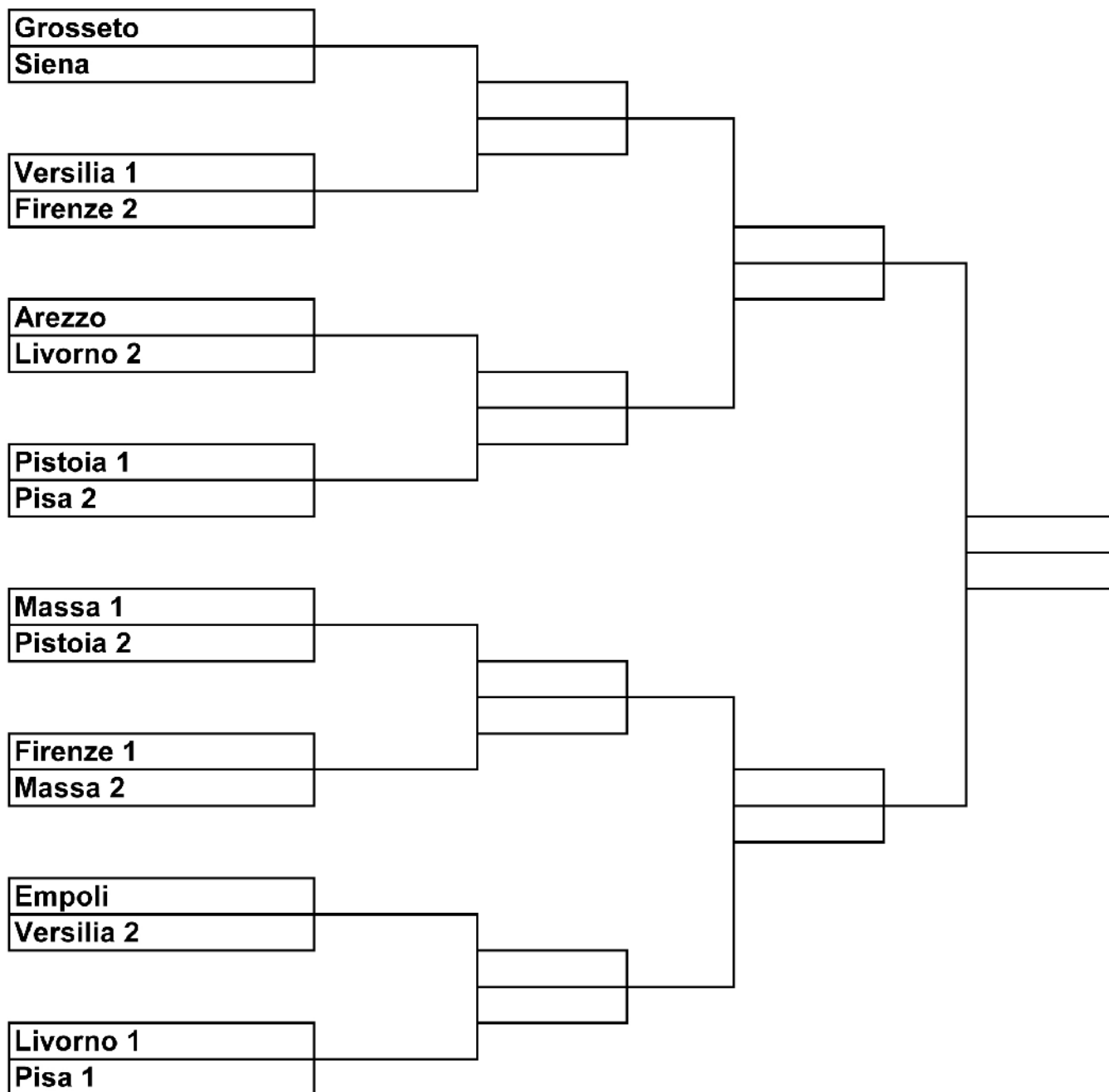
Tabella fasi Finali Regionali di Calcio a 7 Maschile

Martedì 19, Mercoledì 20 e Giovedì 21 Maggio Ottavi di finale